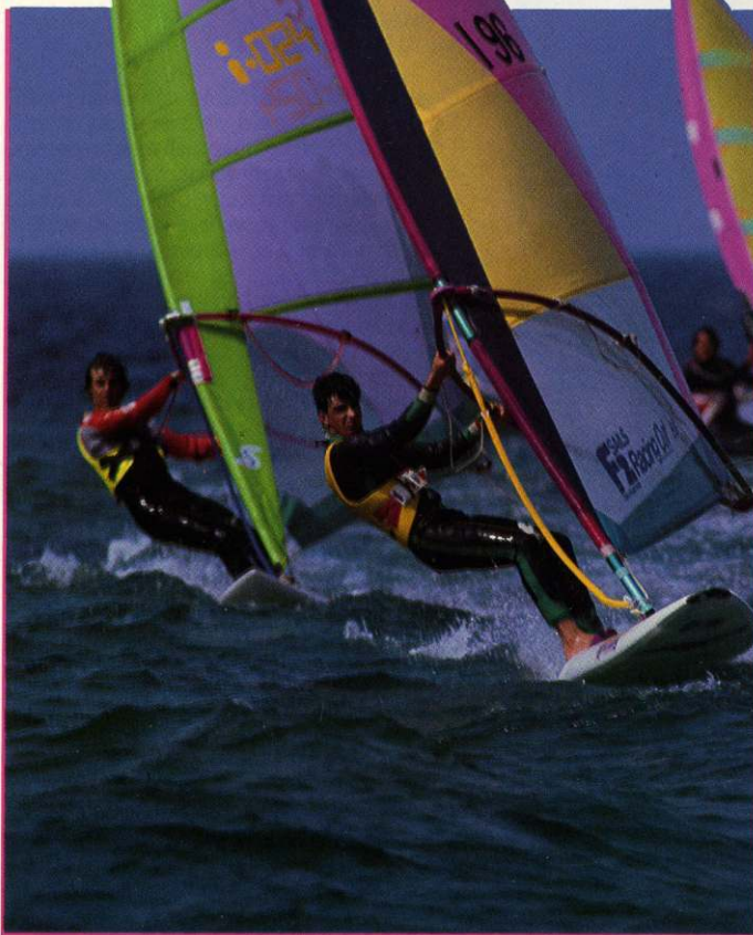
Gli atleti affrontano le raffiche nello slalom