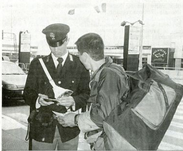
CONTROLLI. La polizia ferma un passeggero davanti al «Leonardo da Vinci»