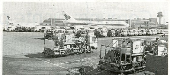
FIUMICINO. L'aeroporto, blindato nei giorni del vertice Nato-Russia, non sarà chiuso al traffico civile