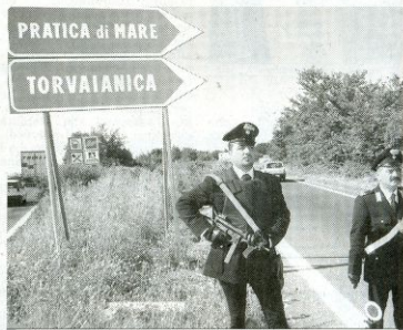
POSTO DI BLOCCO. Le misure di sicurezza in vista del summit