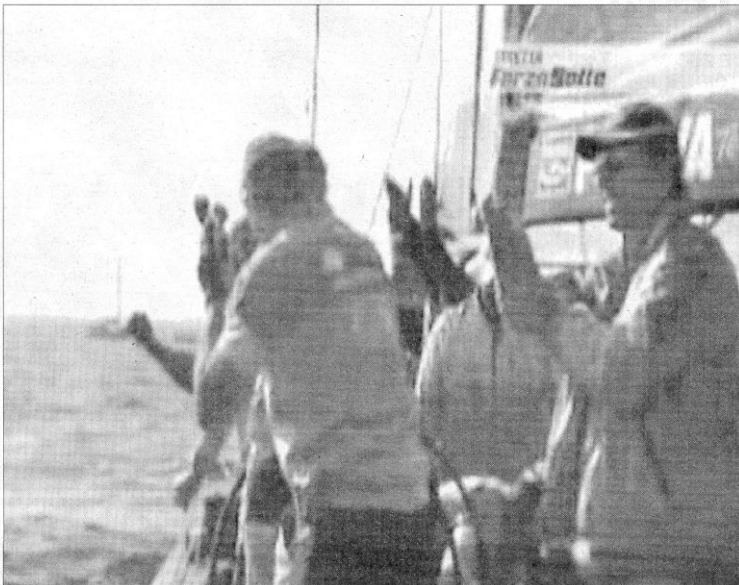
Imagen captada de la televisión en la que se ve al tático del Desafío John Cutler (dcha.) haciendo un corte de mangas.

Pese a todo, Cutler intentó disculparse el sábado personalmente con Vasco Vascotto, patrón del Mascalzone, y se ha justificado diciendo